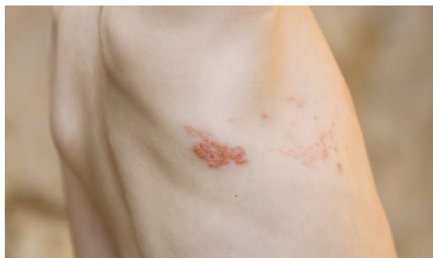
Abb. 1: Gürtelrose konsequent behandeln und so den gefürchteten chronischen Nervenschmerz vermeiden!

Die Deutsche Akademie für Akupunktur | DAA e. V. bildet seit ihrer Gründung Ärzte und Zahnärzte sowohl in der Traditionellen Chinesischen Medizin (TCM), als auch in der Ohrakupunktur aus. Beide Systeme haben ihren festen Stellenwert in den ärztlichen Akupunkturpraxen. Inzwischen haben so viele Ärzte Ihre zertifizierte Ausbildung abgeschlossen, dass sich auch in Ihrer Nähe ein entsprechend ausgebildeter Arzt finden sollte. Auf unserer speziell für Sie ausgerichteten Homepage www.akupunktur.de finden Sie die nach Postleitzahlen ausgerichtete Arztsuche.