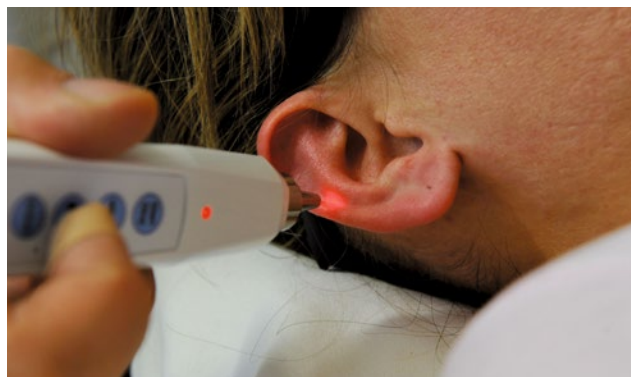
Abb. 2: Laserbehandlung über die Ohrakupunktur