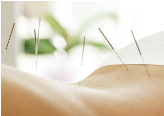
Abb. 2: Akupunktur kann bei männlichen und weiblichen Ursachen der Infertilität eingesetzt werden.

ausgerichtet sein. Insbesondere im Bereich der Ohrakupunktur gibt es Punkte, die sogar direkt mit den Sexualorganen in Verbindung stehen: Ovar (Eierstock), Testes (Hoden), Uterus (Gebärmutter).