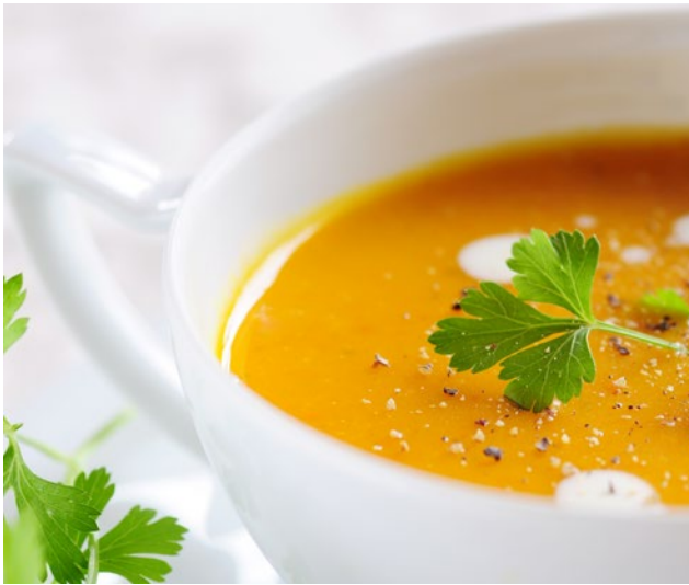
Abb.: Empfehlenswert - eine warme Mahlzeit schon am Morgen