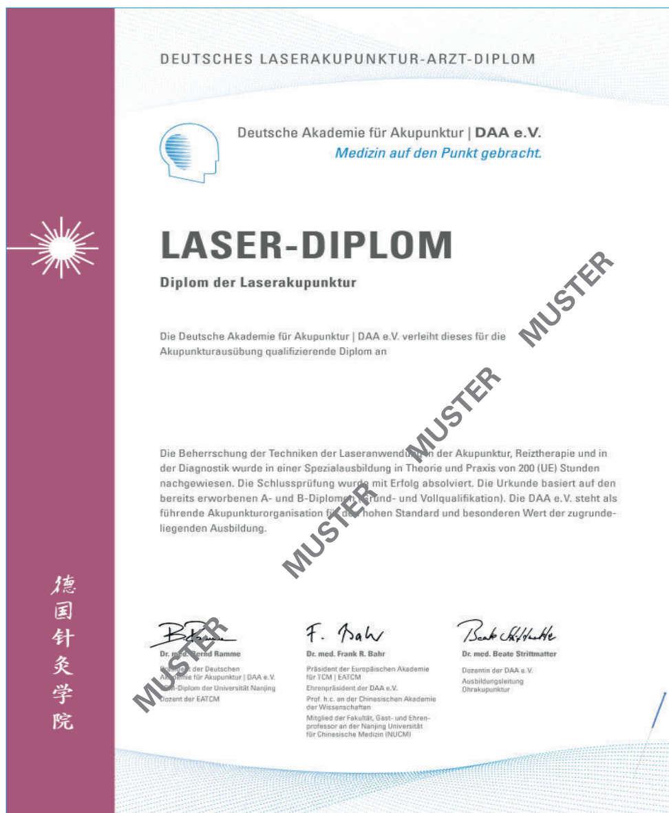
Das Diplom der Laserakupunktur der DAA e.V.

Reservierung über: Telefon 030- 38 38 9 888 oder per E-Mail: reservations@gchotelgroup.com