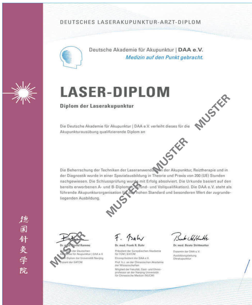
Das Diplom der Laserakupunktur der DAA e.V.

Reservierung über: Telefon 03981 - 20 31 45 oder per E-Mail: reservierung@basiskulturfabrik.de